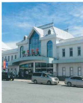
☉: JR米沢駅 (置賜広域観光案内センター ASK)