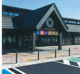
☉: 道の駅 米沢 (総合観光案内所)