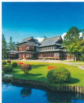
☉: 上杉伯爵邸 (和庭)